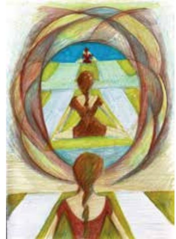
(Drawing: yoga immaterial)

The electromagnetic qualities and the force of gravity with which yoga works are comparable to a phenomenon that in astrophysics is called “The horizon of events”: the boundary surface beyond which no event (state of physical reality observable) can influence an external observer. According to Roger Penrose’s definition, the horizon of events in a black hole is a particular surface of space-time that separates the places from which signals can escape from those from which no signal can escape. In other words, that region of the space-time beyond which it ceases to be possible to observe any type of phenomenon whether it is made up of matter or sound.