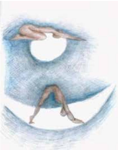
(Drawing: Chandra A)

Chandra Namaskara A and B teach us to let energy flow without forcing it; the dynamic transitions between the asanas are undulating and deeply connect the movement of the limbs to the breath: the body exploits the perpetual motion that once generated, everything transmits and everything carries inexorably.