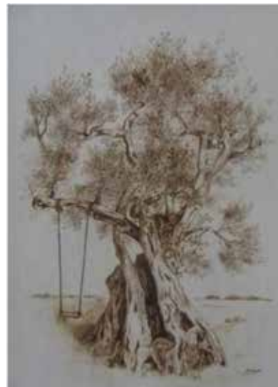
opera di Silvana Bissoli

Ma le trasformazioni sociali e climatiche hanno messo a rischio la salute di questi preziosi arbusti che in Salento presentano segni di sofferenza dovuti ad un complesso processo di disseccamento dalle cause ancora incerte. Sulla base di tesi molto controverse, gli ulivi sembrano condannati a morte dall'incuria. Trasformazioni sociali e climatiche sembrano aver influito negativamente sulla salute dei giganti verdi.